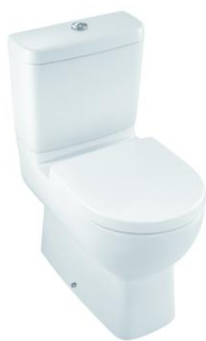
WC compact caréné (E0522)