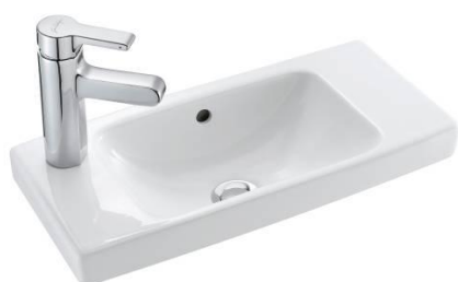
50x22 cm (E4701)