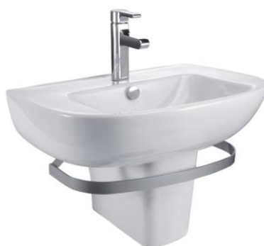
60x44 cm (E4700)