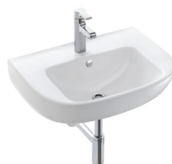
56x37 cm (E4755G)

Des lavabos et lave-mains compacts complètent l'offre pour aménager complètement les petits espaces. L'aspect fonctionnel est préservé, avec une bonne profondeur de cuve et des plages de poses importantes.