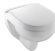
Cuvette suspendue compacte (E4705)