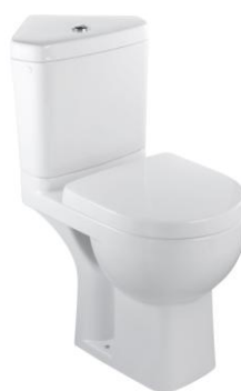
WC d'angle (E0373)