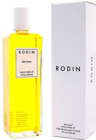
L'huile de luxe pour le corps Rodin, 125 $