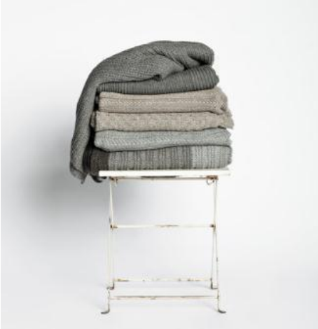
Les oreillers et les jetés Aiayu, de 135 $ à 400 $

à son implication, Aiayu est devenue synonyme d'essentiels de tous les foyers.