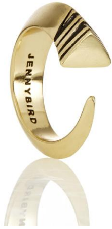
La bague Tusk de Jenny Bird, 70 $