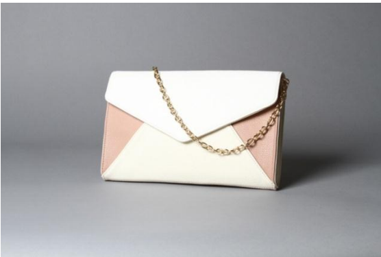
La pochette Cornelia Guest, 170 $