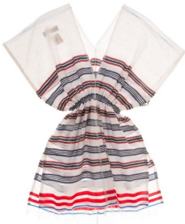
La tunique Lemlem, 215 $

Mannequin, actrice et ancienne ambassadrice de bonne volonté pour la santé des mères, des nouveau-nés et des enfants auprès de la World Health Organisation, Liya Kebede a découvert que les tisseurs traditionnels de son pays natal, l'Éthiopie, perdaient leur emploi en raison d'un déclin de la demande locale pour les biens produits et désirait faire quelque chose pour remédier à cette situation. Reconnaisant la splendeur, la qualité et l'histoire significative de leur ouvrage, Liya a fondé Lemlem en 2007 afin d'inciter ses concitoyens à être indépendant économiquement et de préserver l'art du tissage. Aujourd'hui, Lemlem, qui signifie florissant ou épanouissement en amarigna, se porte très bien. La designer remercie ceux qui contribuent à appuyer cette collection faite à la main de vêtements pour femmes et enfants, tout en aidant à préserver cette forme d'art ancien.