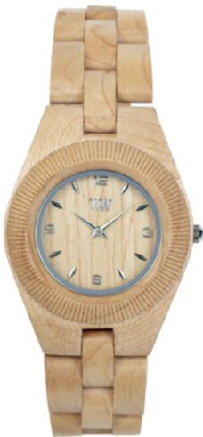
La montre WeWood, 120 $

WeWood a été illustrée dans les magazines Vogue , GQ , Marie Claire , Elle États-Unis, ainsi que les journaux The New York Times et Los Angeles Times .