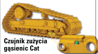
Czujnik zużycia gąsienic Cat