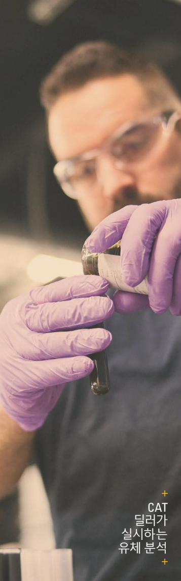
+ CAT 딜러가 실시하는 유체 분석

목표는 간단합니다. 소유 비용을 보다 예측 가능한 운영 비용으로 전환하고, 서비스 및 수리 계획을 더욱 효과적으로 수립하며, 기계의 전체 수명 동안 투자를 보호하는 것입니다. 장비 활용도가 높은 기업이나 장기 소유주에게 있어, '확신'이라는 이름 그대로의 신뢰성을 제공합니다.