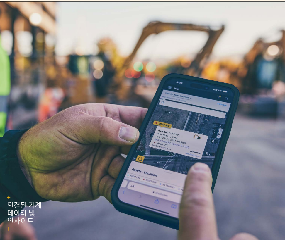
+ 연결된 기계 데이터 및 인사이트

그 결과, 조정 작업이 줄어들고, 가동 중단이 감소하며, 유지 관리가 매번 제대로 이루어진다는 확신을 얻을 수 있습니다.