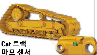
Cat 트랙 마모 센서