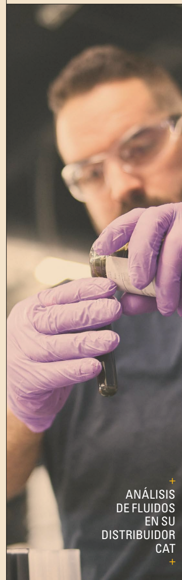
+ ANÁLISIS DE FLUIDOS EN SU DISTRIBUIDOR CAT

El objetivo es sencillo: convertir la propiedad en un coste operativo más predecible, planificar el servicio y las reparaciones de forma más eficaz y proteger su inversión durante toda la vida útil de la máquina. Para flotas de uso intenso y propietarios a largo plazo, el acuerdo de confianza ofrece exactamente lo que su nombre indica.