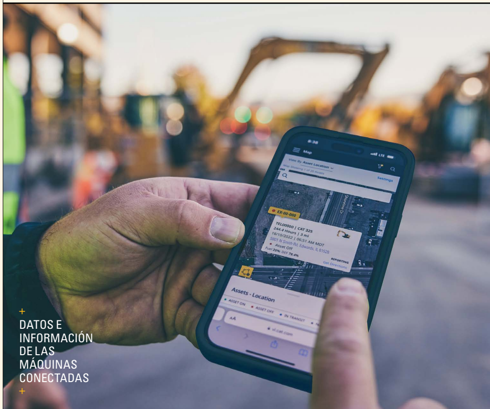
+ DATOS E INFORMACIÓN DE LAS MÁQUINAS CONECTADAS

El resultado: menor necesidad de coordinación, menos interrupciones y la confianza de que el mantenimiento se hace bien siempre .