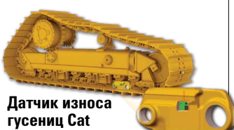
Датчик износа гусениц Cat