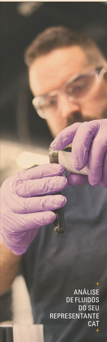
+ ANÁLISE DE FLUIDOS DO SEU REPRESENTANTE CAT +

O objetivo é simples: transformar a propriedade em um custo operacional mais previsível, planejar a manutenção e os reparos de forma mais eficaz e proteger seu investimento ao longo de toda a vida útil da máquina. Para frotas de alta utilização e proprietários de longa data, o Confidence cumpre exatamente o que promete.