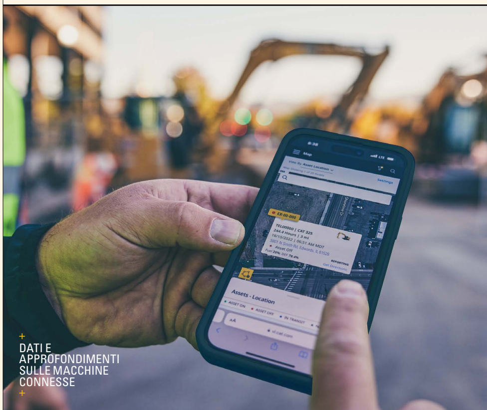
+ DATI E APPROFONDIMENTI SULLE MACCHINE CONNESSE

Il risultato: meno coordinamento, meno interruzioni e la certezza che la manutenzione venga eseguita correttamente ogni volta .