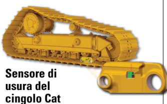
Sensore di usura del cingolo Cat