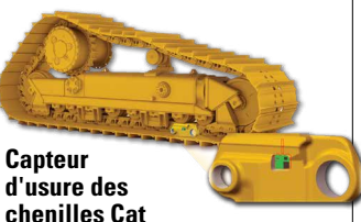
Capteur d'usure des chenilles Cat