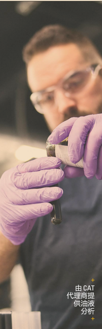
由 CAT 代理商提供油液分析

这种设计的目标很简单: 就是将机器拥有成本转化为更可预见的运营成本, 更高效地规划维护和维修工作, 在机器全生命周期内为您的投资保驾护航。 对于高负荷运营车队及长期持有设备的客户而言, 安心型方案正如其名, 带来切实的安心保障。