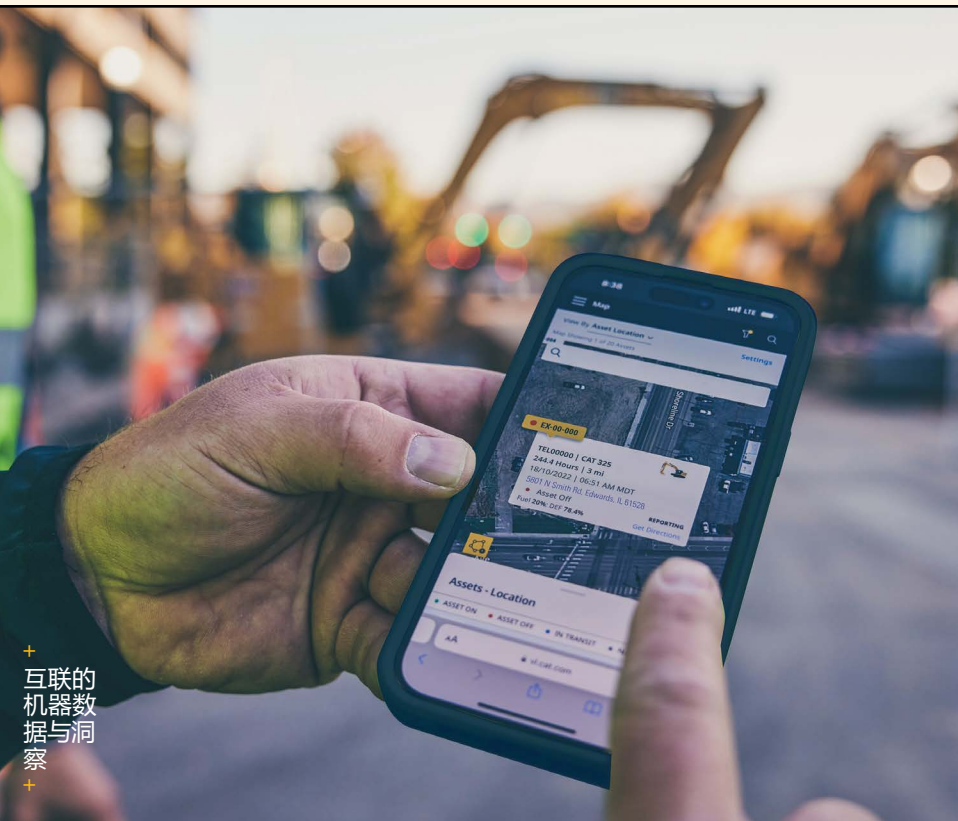
互联的机器数据与洞察

最终成效: 协调负担更轻、中断情况更少, 同时让您放心, 每次维护工作都精准到位。