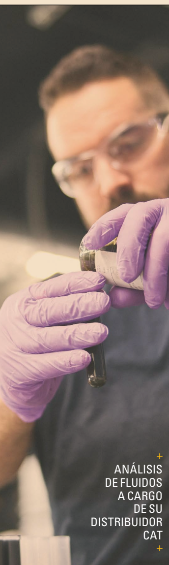
+ ANÁLISIS DE FLUIDOS A CARGO DE SU DISTRIBUIDOR CAT

El objetivo es simple: convertir la propiedad en un costo operativo más predecible, planificar el servicio y las reparaciones de manera más efectiva y proteger su inversión durante toda la vida útil de la máquina. Para flotas de alta utilización y propietarios a largo plazo, Confidence ofrece exactamente lo que su nombre indica.