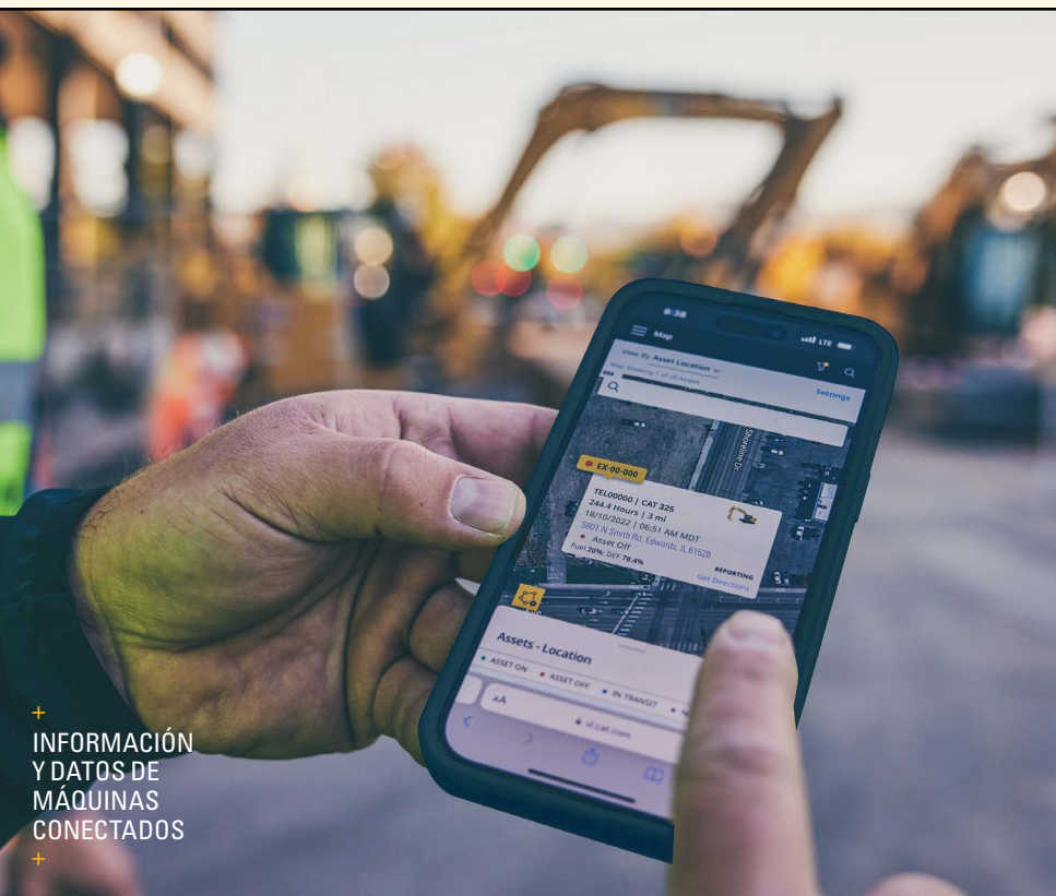
+ INFORMACIÓN Y DATOS DE MÁQUINAS CONECTADOS

El resultado: menos coordinación, menos interrupciones y la confianza de que el mantenimiento se realiza correctamente en todo momento .