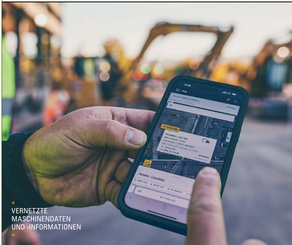
VERNETZTE MASCHINENDATEN UND -INFORMATIONEN

Das Ergebnis – weniger Koordinationsaufwand, weniger Störungen und die Gewissheit, dass die Wartung jedes Mal korrekt durchgeführt wird.