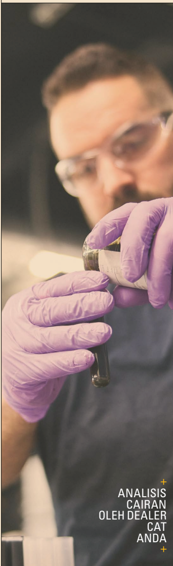
+ ANALISIS CAIRAN OLEH DEALER CAT ANDA

Untuk armada dengan utilitas tinggi dan pemilik jangka panjang, CVA Keandalan memberikan tepat seperti yang dijanjikan namanya.