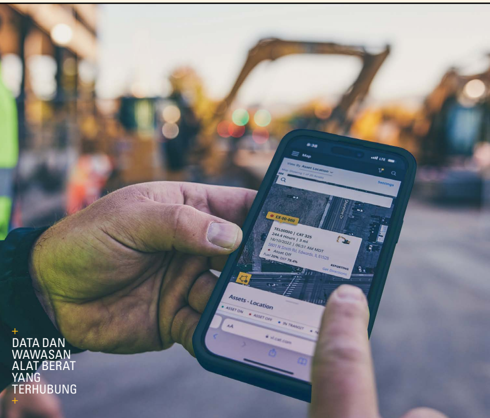
+ DATA DAN WAWASAN ALAT BERAT YANG TERHUBUNG

Hasilnya — koordinasi yang lebih sedikit, gangguan yang lebih minim, dan keyakinan bahwa pemeliharaan dilakukan dengan benar setiap saat .