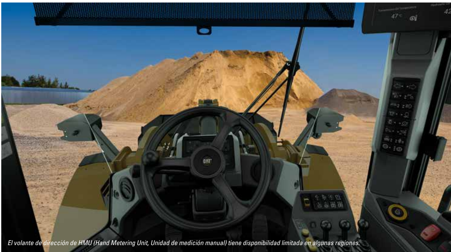
El volante de dirección de HMU (Hand Metering Unit, Unidad de medición manual) tiene disponibilidad limitada en algunas regiones.

La cabina está diseñada para mejorar la comodidad y la eficiencia, proporcionando un espacio de trabajo silencioso y más amplio con controles fáciles de usar para minimizar la fatiga, el estrés, el ruido y el calor durante las tareas más exigentes.