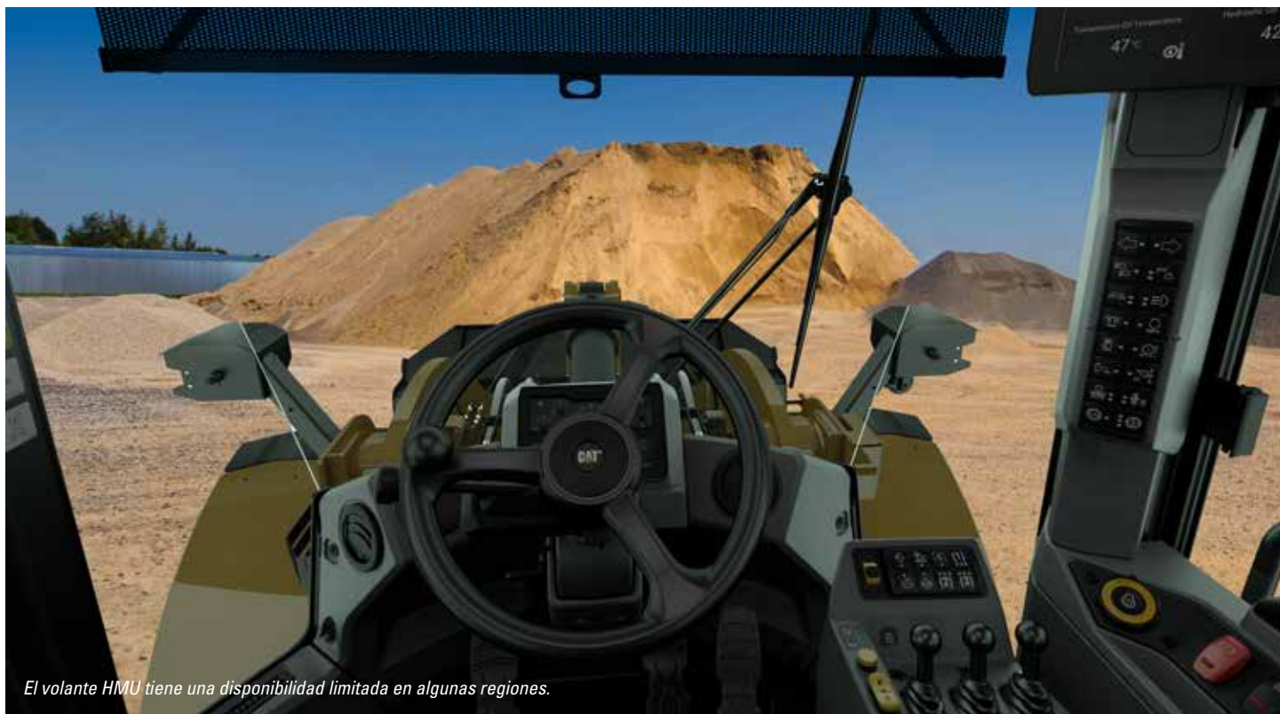
El volante HMU tiene una disponibilidad limitada en algunas regiones.

La cabina, diseñada para aumentar la comodidad y eficiencia del operador, ofrece un espacio de trabajo más amplio y silencioso con unos controles de fácil manejo que reducen la fatiga, el esfuerzo, el ruido y el calor durante las tareas más exigentes.