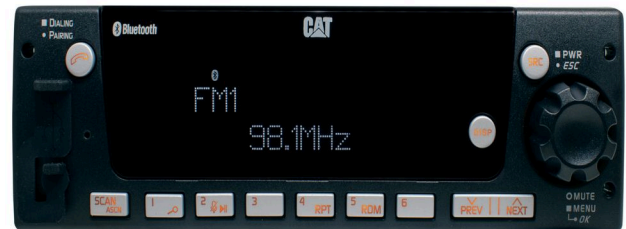
Fig. 1 AM/FM/Bluetooth/USB/AUX