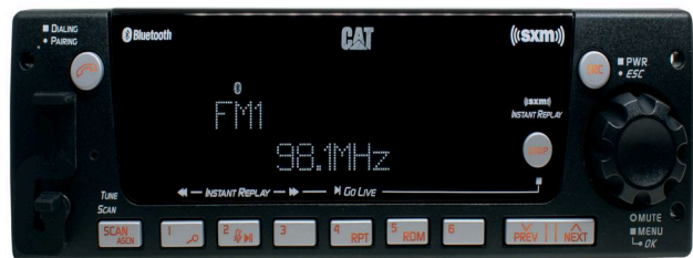
Fig. 2 SXM/AM/FM/Bluetooth/USB/AUX