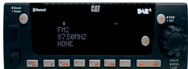
Fig. 3 DAB/AM/FM/Bluetooth/USB/AUX