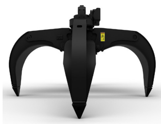
GSH – MEHRSCHALENGREIFER