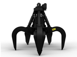
GSV – MEHRSCHALENGREIFER