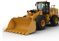
CARGADORAS DE RUEDAS