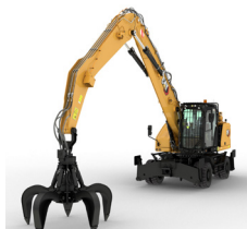
MANIPULADORAS DE MATERIALES