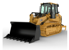
CARGADORAS DE CADENAS