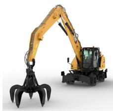
KOPARKI DO PRAC PRZEŁADUNKOWYCH