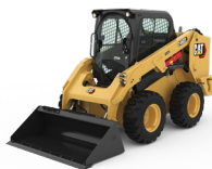
ŁADOWARKI O STEROWANIU BURTOWYM