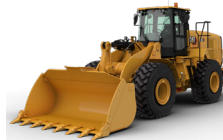
CHARGEUSES SUR PNEUS