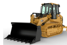
CHARGEUSES À CHENILLES