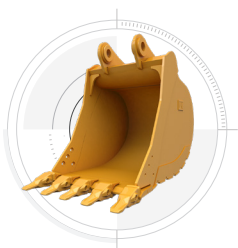
標準掘削 バケット