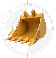
強化型掘削 バケット