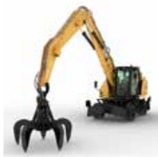
MANIPULADORES DE MATERIALES