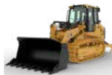
CARGADORES DE CADENAS