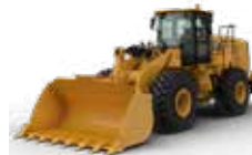
CARGADORES DE RUEDAS