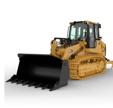
CARGADORES DE CADENAS