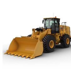
CARGADORES DE RUEDAS