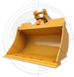
KANTELBARE SLOTENBAKKEN 2