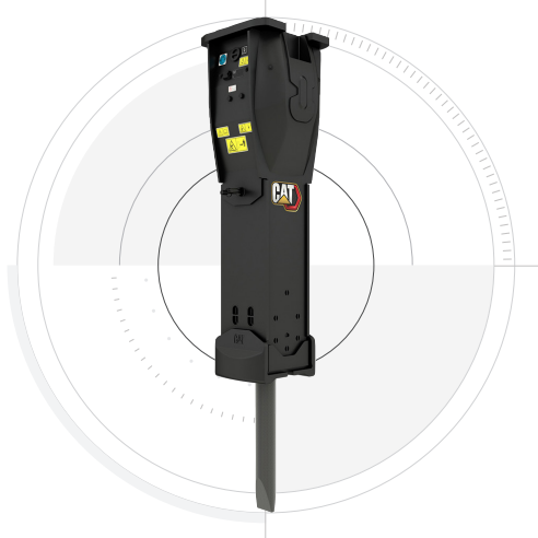
液压锤和更多作业机具

无论是破碎岩石、切割钢材，还是抓取和装载物料，Cat 液压机械作业机具都能帮助您完成更多工作，获利更多。