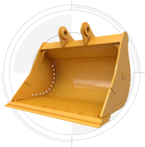
GOGETS DE CURAGE DE FOSSES