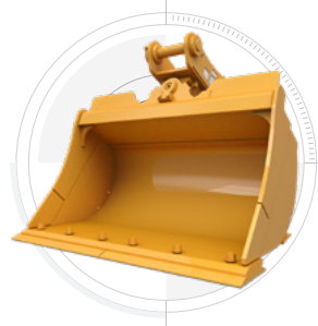
GOGETS DE CURAGE DE FOSSES BASCULANTS 2