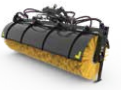
Brosses orientables et balayeuses-ramasseuses