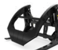
Garfos para Madeiras