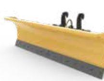
Arados para Neve