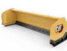
Palas para nieve