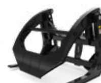
Horquillas para playas de aserraderos