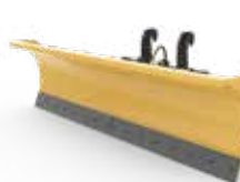
Hojas para nieve