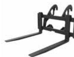
Horquillas para palés