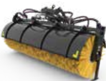
Cepillos angulares y de recogida