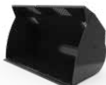
Cucharones para material liviano