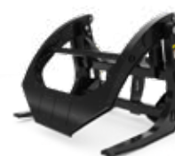
Fourches de scierie