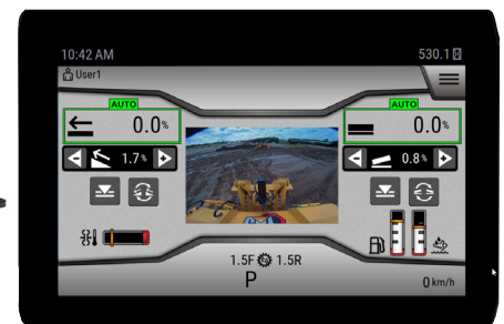
Interfaccia operatore di nuova generazione