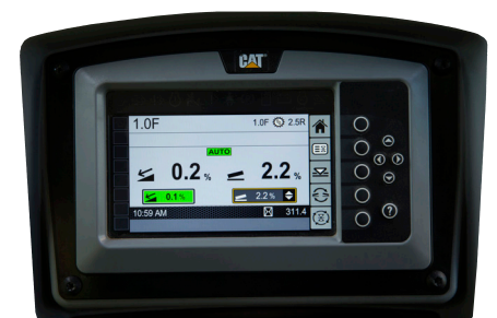
Display a cristalli liquidi