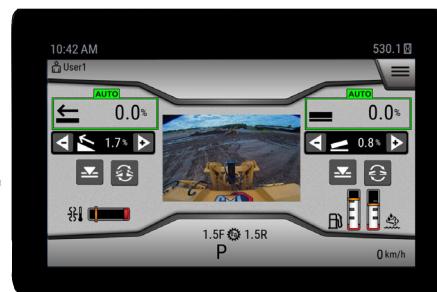
Interfejs operatora nowej generacji