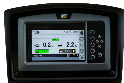
Wyświetlacz ciekłokrystaliczny (LCD)

*System Grade nowej generacji z funkcją 3D jest dostępny w coraz większej liczbie spycharek Cat. Skontaktuj się z najbliższym dealerem Cat w sprawie dostępności systemu w konkretnych modelach.