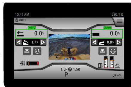
次世代オペレータ インターフェイス