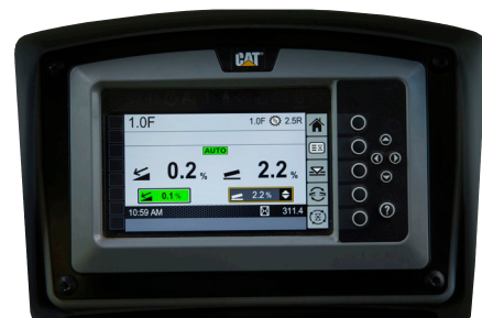
液晶ディスプレイ (LCD)

*次世代グレード3Dを装着可能な機種が増えています。 お買い求めについては、お近くのCatディーラーにご相談ください。