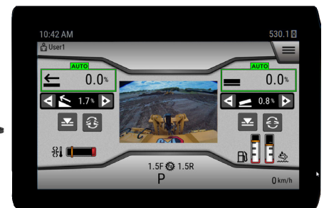
Interface do Operador de Última Geração