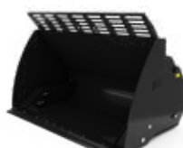
Cucharones de descarga alta