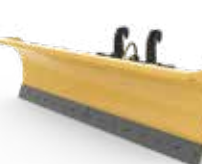
Hojas para nieve