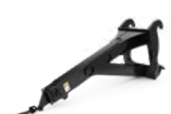
Brazos de manipulación de materiales