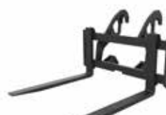
Horquillas para paletas