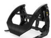
Horquillas para playas de aserraderos