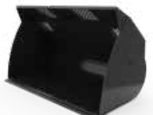
Cucharones para material liviano