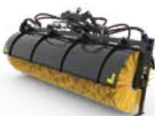
Cepillos angulares y de recogida