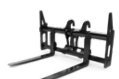
Horquillas para construcción