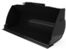
Cucharones de uso general

Aproveche más su máquina con los accesorios Cat. Elija entre una amplia variedad de opciones y adapte su máquina a diferentes tareas y condiciones.