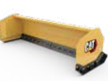
Palas para nieve