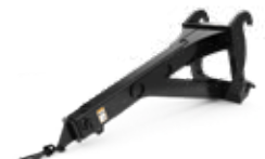
Bras de manutention