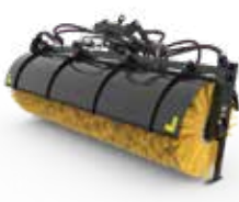
Brosses orientables et balayeuses-ramasseuses