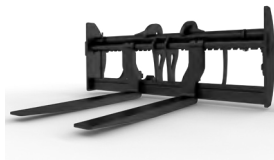
HORQUILLAS PARA PALETAS