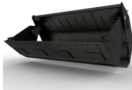
CUCHARÓN DE USO MÚLTIPLE