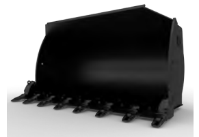
CUCHARÓN DE USO GENERAL