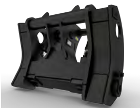
ACOPLADOR RÁPIDO FUSION