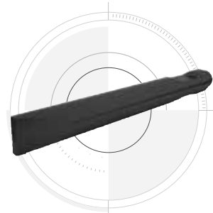
SCALPELLO (taglio trasversale)

Favorisce la creazione di una linea di frattura accurata e controllata. Per l'utilizzo su pavimentazione, cemento, terreno roccioso, fossati, pendenze e linee di taglio.