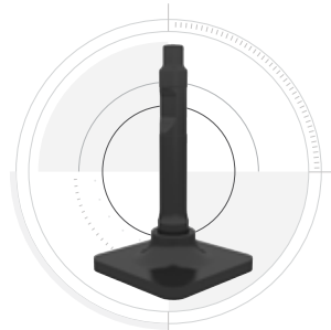
PIASTRA DI COMPATTAZIONE

Ideale per compattare terra, ghiaia e altri materiali.