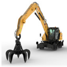
MANIPULADORES DE MATERIALES