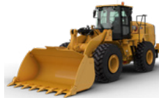
CARGADORES DE RUEDAS