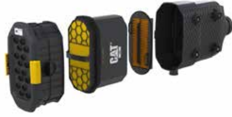
Motor Hava Filtresi

Cat Hava Filtreleri, motora veya makine kabine giren havanın sürekli temizlenmesinden sorumludur. Hava filtreleri toz, kir, kurum gibi kirleticileri ve hava ile taşınan diğer partikülleri manuel olarak giderip temizlemeye gerek kalmadan etkili bir şekilde ortadan kaldırmak üzere tasarlanmıştır. Geleneksel filtrelere göre daha fazla kapasite sunan Cat standart motor hava filtreleri, normal hizmet tipi filtreleme gerektiren çoğu uygulama için tavsiye edilir. Standart hava filtreleri, tüm Cat ekipman modellerinde kullanılabilir. Cat Ultra Yüksek Verimli (UHE) Filtreler, standart filtrelere göre daha uzun kullanım ömrüne sahiptir. UHE filtreler, çoğu Cat ekipman modellerinde kullanılabilir. Geliştirilmiş kir tutma kapasitesiyle filtre elemanının servis ömrünü uzatmaları nedeniyle bu filtreler ince tozlu uygulamalar için önerilir. Her iki filtre türü de makineniz için mükemmel koruma sağlar.