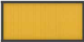
Kabin Hava Filtresi

Cat Filtre Kalan Faydalı Kullanım Ömrü (RUL) özelliği, bazı Cat ekipmanlarında motor hava filtreleri için mevcuttur. Algoritma, filtre elemanında kalan kullanım ömrüyle ilgili bilgi vermek için hava filtresi basınç düşüşü gibi gerçek motor ve makine verilerini toplamak üzere sensörler kullanır. RUL, iş sahası koşullarına ve çalışma parametrelerine dayanarak filtre ömrüyle ilgili duruma özgü içgörüler sağlar. Bu da servis zamanlaması için daha fazla içgörü sunarken müşterilerin filtrenin faydalı kullanım ömrünün tamamından yararlanabilmelerini sağlar. Mevcut seçeneklerinizi öğrenmek için yerel Cat temsilcinize danışın.