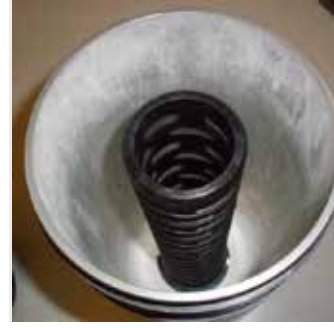
Muhafazasından Çıkarılmış "Çekirdeksiz" Eleman