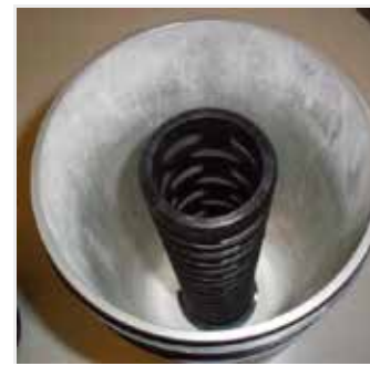
Elemen "Tanpa Inti" Dihilangkan dari Rumah