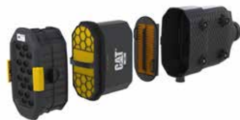
Filter Udara Engine