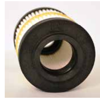
Elemen "Tanpa Inti"

Filter Hidraulik dan Transmisi Cat diproduksi sesuai spesifikasi Caterpillar dan telah melalui uji laboratorium dan uji lapangan yang ketat. Filter ini memberi sistem Anda perlindungan yang dibutuhkan untuk meningkatkan kinerja. Filter Cat, Cairan, dan S-O-S Cat didesain untuk bekerja bersama untuk meningkatkan kinerja sistem hidraulik dan transmisi. Anda juga akan mendapatkan dukungan dari jaringan dealer yang terbaik di kelasnya yang dibantu oleh berbagai solusi, teknologi, alat, dan sarana lainnya yang fleksibel. Intinya adalah dukungan yang dibangun untuk membantu kesuksesan Anda.