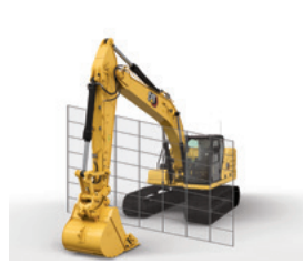
E-WALL KABİN KORUMASI