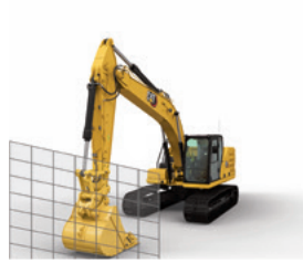
E-WALL İLERİ GÖNDERME