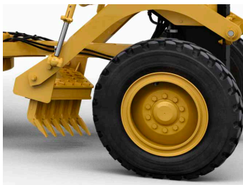
ESCARIFICADOR DE MONTAJE INTERMEDIO