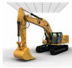
Eウォールシーリング