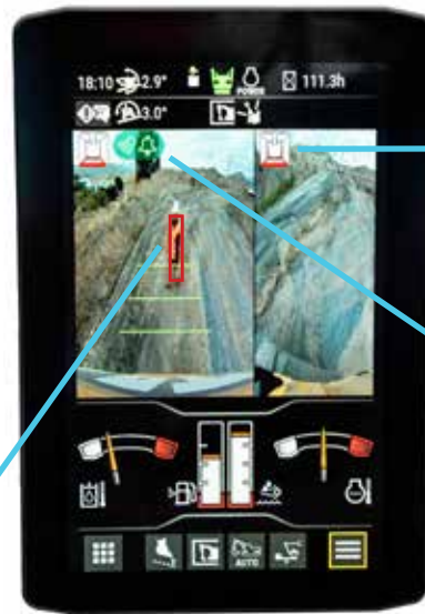
Vue dans caméra