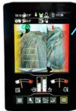
Vue hors caméra