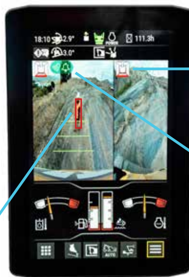
I kamerans sikt