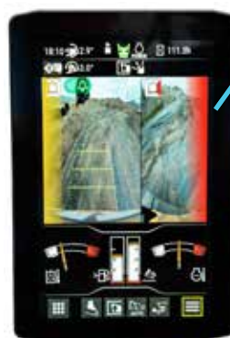
Vy utanför kamerans sikt