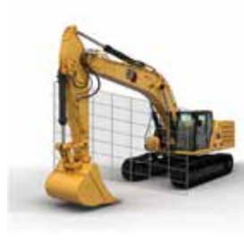
驾驶室保护电子墙壁