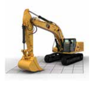
电子墙壁最低限度